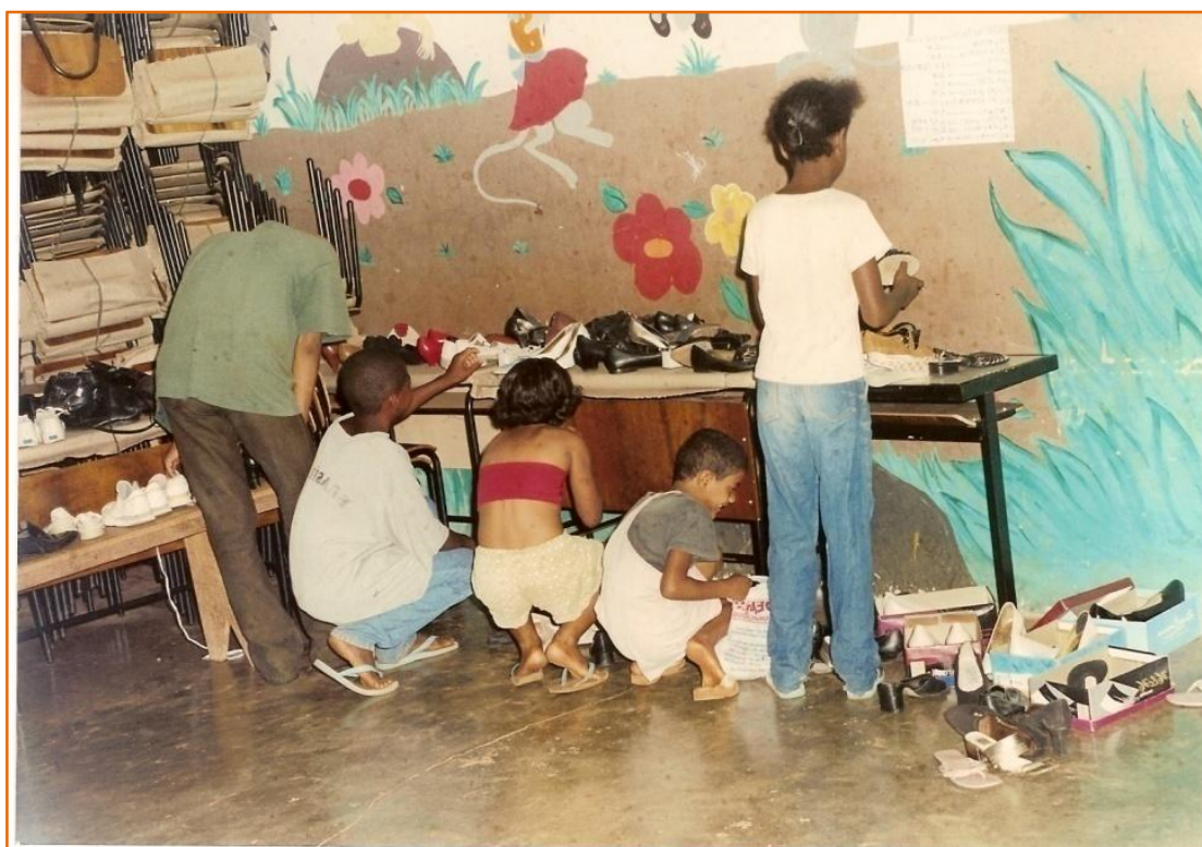
Figura 27 - Bazar da Pechincha improvisada em salas de aulas da Escola Estadual de Pontalinda.

As pessoas vão de banca em banca na busca de um produto que lhe sirva, ou que sirva para alguém de sua família. Muitas vezes, “o melhor produto” não veste bem em nenhum dos membros da família, mesmo assim, estas o adquirem, não importa se a peça fica um pouco larga para o filho menor, e um pouco apertado para o maior, acaba levando assim mesmo. Assim como o calçado novo que não lhe serve, porque o número é menor que o de seu uso, não lhe incomoda porque é só uma questão de tempo para amaciar. Se o número é maior, o discurso está na ponta da língua “mais folgado é mais confortável”.