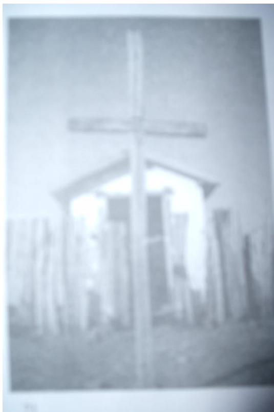
Figura 17 - Capela de Cemitério.*

Os longos períodos de seca ameaçavam as plantações e as pastagens dos animais. Buscavam na fé a solução, era muito comum a realização de novenas para chover.