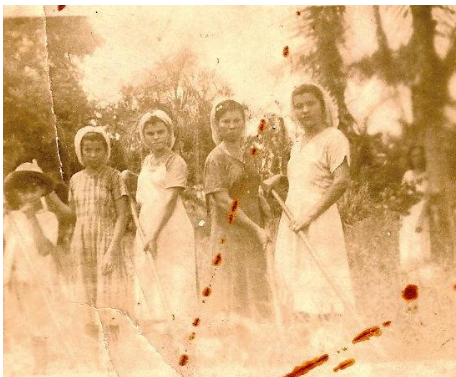
Figura 7 - Foto de uma das primeiras famílias a migrarem para a região do Noroeste Paulista.*

As mulheres são evidenciadas na foto abaixo sugerindo a presença feminina como parte constitutiva desta experiência. Nesse tempo não se falava em explorar o trabalho infantil no meio rural, pois ensinar às crianças as práticas do trabalho era motivo de honra para os pais de famílias desafortunadas.