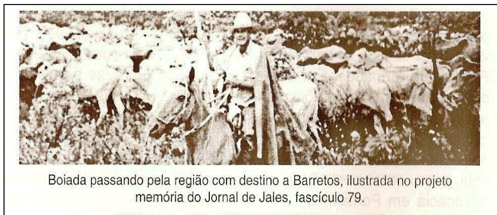
Boiada passando pela região com destino a Barretos, ilustrada no projeto memória do Jornal de Jales, fascículo 79.