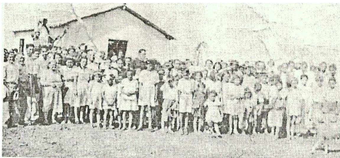
Figura 6 - Foto da primeira missa realizada na capela em 15/08/1948.*

Diante de tanta influência da igreja católica, que teve a primeira missa celebrada no dia 15 de agosto de 1948, data de fundação da cidade, segundo a história oficial, vem o questionamento: Seria esta data a da primeira missa ou da fundação da cidade?