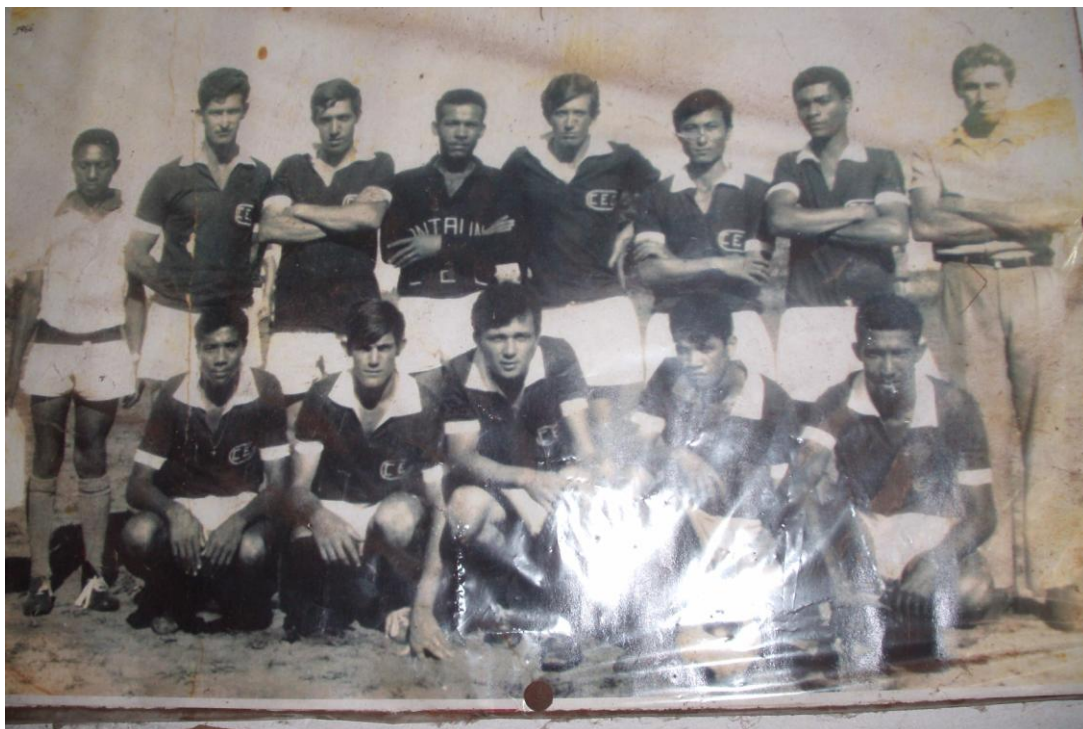
Figura 14 - Time de futebol.*

televisão, trazem também para o noroeste paulista “o rock, que é a linguagem universal das festas juvenis. 124 Elvis Presley, Raul Seixas entre outros, músicas da Jovem Guarda de Roberto Erasmo Carlos e Companhia, contagiam jovens e, com eles, as novidades da moda, como o uso da minissaia, uma resistência por parte dos mais velhos, mas que acabaram aderindo com alguns centímetros a mais no comprimento e os outros tipos de produtos que começam a entrar nos lares através da televisão.