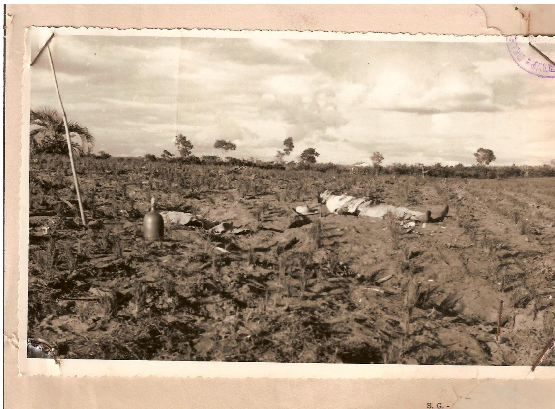
Figura 25 - Foto de Pedro Ângelo morto em roça de arroz.

a leitura do auto de prisão em flagrante delito nos termos do artigo 121. CPB 304 , escrito à máquina, com data de 12 de dezembro de 1968, data do ocorrido.