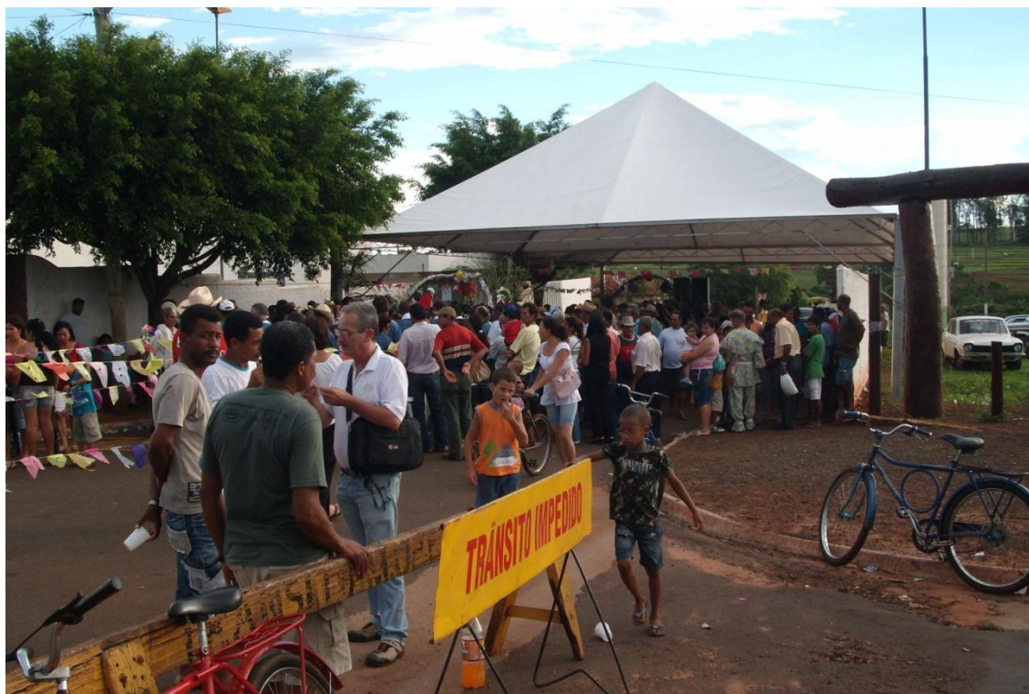
Figura 31 - Festa da Chegada da Companhia de Santos Reis, no Centro Comunitário de Pontalinda.*