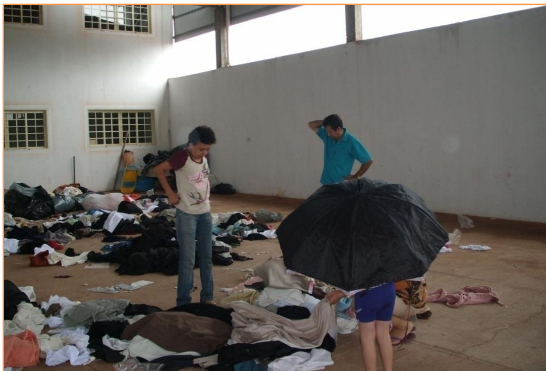
Figura 29 - Bazar da Pechincha realizado no salão de festa da igreja Católica.*