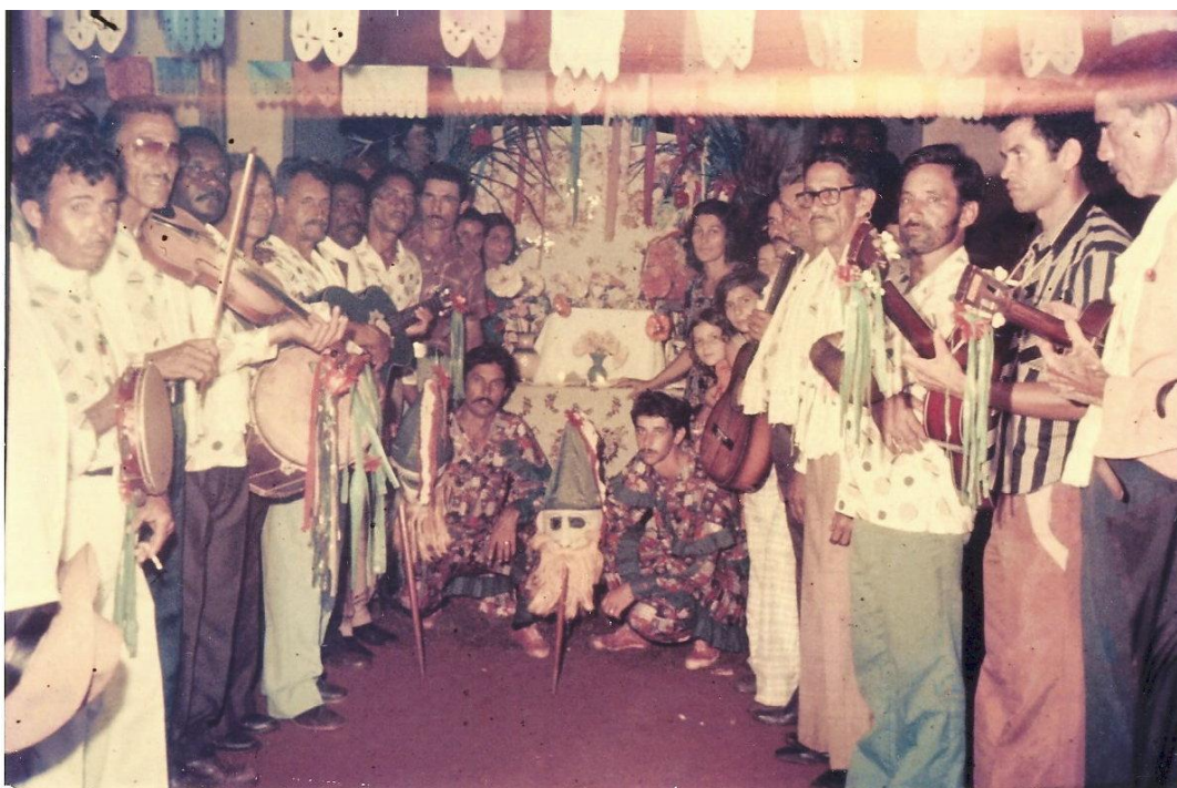
Figura 19 - Chegada da Companhia de Santos Reis.*

Fotógrafos profissionais, eram contratados para registrar a Folia de Santos Reis no dia da festa. A foto (figura 19) tirada em frente ao altar, logo após a celebração do terço. A passagem da coroa para os festeiros do próximo ano, havia uma preocupação para que todas as pessoas que ajudaram nos festejos estivessem com os foliões perfilados e os dois palhaços distinguidos pela roupa e mascaras, com destaque ao centro, onde se curvavam para que fosse visualizado o altar numa demonstração de fé. Momento de despedida dos festeiros daquele ano, abraços dos foliões, ajudantes de cozinha e cozinheiros, do macaqueiro, 155 as mulheres responsáveis pelos enfeites, do rezador de terço e de todos os que ajudaram para que acontecesse a festa. O festeiro agradecia a todos por intermédio dos versos do mestre, que os demais foliões acompanhavam com um dueto. Tudo terminava com vivas dos palhaços que, em trova, não esqueciam de ninguém. Na maioria das vezes, os festeiros, sem palavras e com os olhos cheios de lágrimas, agradeciam aos Santos Reis pela bênção alcançada e pela grandeza da festa e abraçando um a um, despediam-se agradecendo pela presença e pela ajuda.