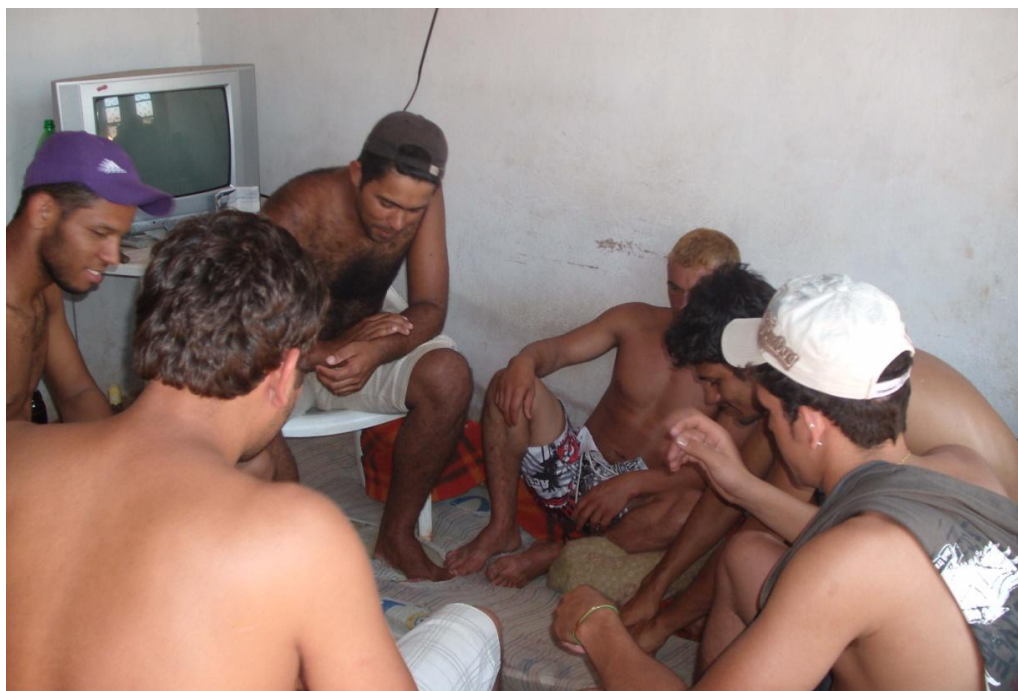
Figura 30 - Migrantes nordestinos em dia de folga.*