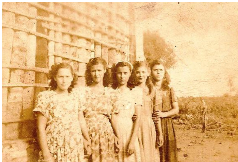
Figura 8 - Fotografia de moças em um final de semana.*

foto, para essas jovens, poderia representar não apenas um recurso de demonstração de ambiente do período de colonização da região, de um lugar próspero, mas também “uma maneira de congelar o tempo” 107 de juventude.