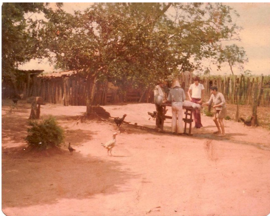
Figura 16 - Abate de animais domésticos.*

Vale ressaltar que o tabaco era muito usado pelos trabalhadores rurais, (o “paieiro,” o fumo enrolado em uma palha de milho). O cultivo e a produção do tabaco estavam presentes na região de Pontalinda e, como as demais plantações exigiam muito cuidado com as ervas daninhas, o trabalho de enxada, arado estavam presentes. Era uma plantação em que precisava estar atento também com pragas, principalmente a lagarta das folhas. A colheita e a produção do tabaco eram efetuadas de forma manual.