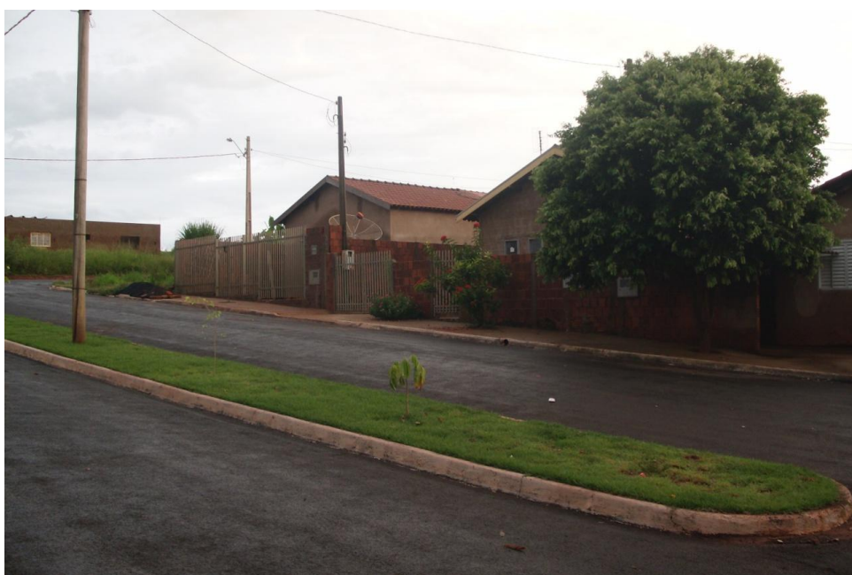
Figura 26 - Área destinada aos trabalhadores sem teto.*

conversamos e decidimos que iríamos ouvir o que o prefeito teria a propor. Caso as propostas fossem insatisfatórias, ninguém tomaria uma decisão de imediato. Com esta decisão, no dia seguinte, à noite, fomos para a Câmara Municipal. Era grande o movimento. Todos os interessados estavam presentes com familiares e amigos, os assentos não foram suficientes para acomodar todas as pessoas. Era um momento de tensão, com a presença de assessores, funcionários do alto escalão do governo municipal, a presença da polícia militar, advogado da Prefeitura, alguns vereadores da situação que davam um respaldo ao Prefeito Municipal. A presença dessas pessoas, para mim, representava propostas nada satisfatórias. O prefeito, para minha surpresa, iniciou a reunião informando que todos os coproprietários dos terrenos deveriam levar seus documentos até o Departamento de Assistência e Promoção Social, no dia seguinte, para a possível legalização dos mesmos. Falou da possibilidade de estar fazendo um convênio com a Caixa Econômica Federal, para a construção das casas (o que não aconteceu até o ano de 2010). Então, foi um alívio para aquelas pessoas. Naquele momento, percebia-se nos rostos que viravam para trás, em minha direção, como se dissessem, vencemos. Não conseguia entender tal decisão, só depois que tivemos conhecimento que o Ministério Público tinha pedido arquivamento da denúncia.