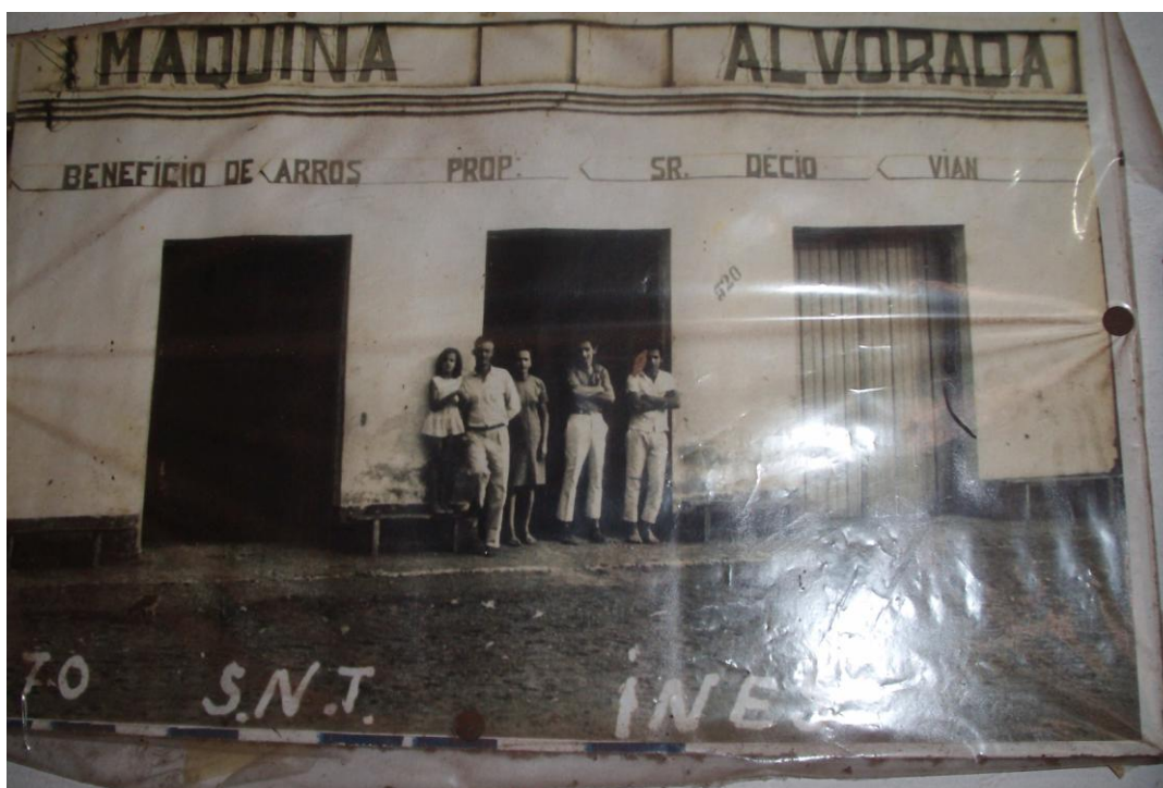
Figura 11 - Máquina de arroz.*

pés de café. Pela sua resistência, poucos tinham o cuidado de deixar a terra limpa até a sua colheita, (exceto nos casos das plantações em meio às lavouras de café) o que tornava sua colheita um tanto penosa, realizada manualmente. “A quebra de milho,” como era chamada a colheita pelos trabalhadores que apanhavam as espigas e amontoavam em pequenos montes espalhados em meio à plantação, chamadas de “bandeiras”, posteriormente eram juntadas em balaios e transportadas em carros de bois e carroças para o paiol. As ervas daninhas como malícia, carrapichos, cipós e outras, eram o empecilho dos trabalhadores que tentavam proteger seu corpo com perneiras, calças de lona, ou improvisando sacos de plástico (embalagens de adubos químicos já nos finais da década de 1960), para a realização dessas atividades.