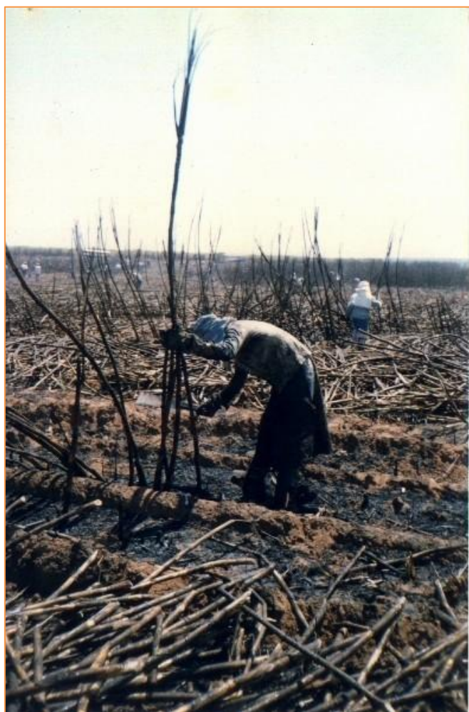
Figura 22 - Cortador de cana desconhecido.

entregaram as fotos no meio da rua. A foto acima chegou as minhas mãos de uma outra maneira. Foi deixada no meu trabalho, em um envelope destinado para mim, mas sem remetente. A pessoa responsável que me entregou não soube explicar quem a deixou. Depois de interrogar todos aqueles que me ajudaram na coleção de documentos, não consegui descobrir o personagem.