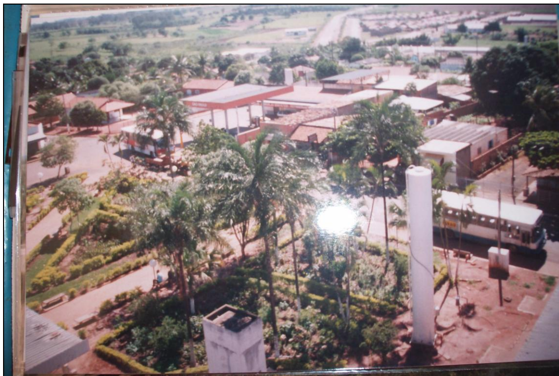
Figura 1 - Foto da praça central.

ex-proprietário das terras (o que estaremos discutindo no terceiro capítulo). Estes espaços físicos, que “são demarcados pela inclusão e exclusão social, dentro de um sistema de relações sociais que permite e impede (...) o acesso a determinados recursos materiais e simbólicos”. 45