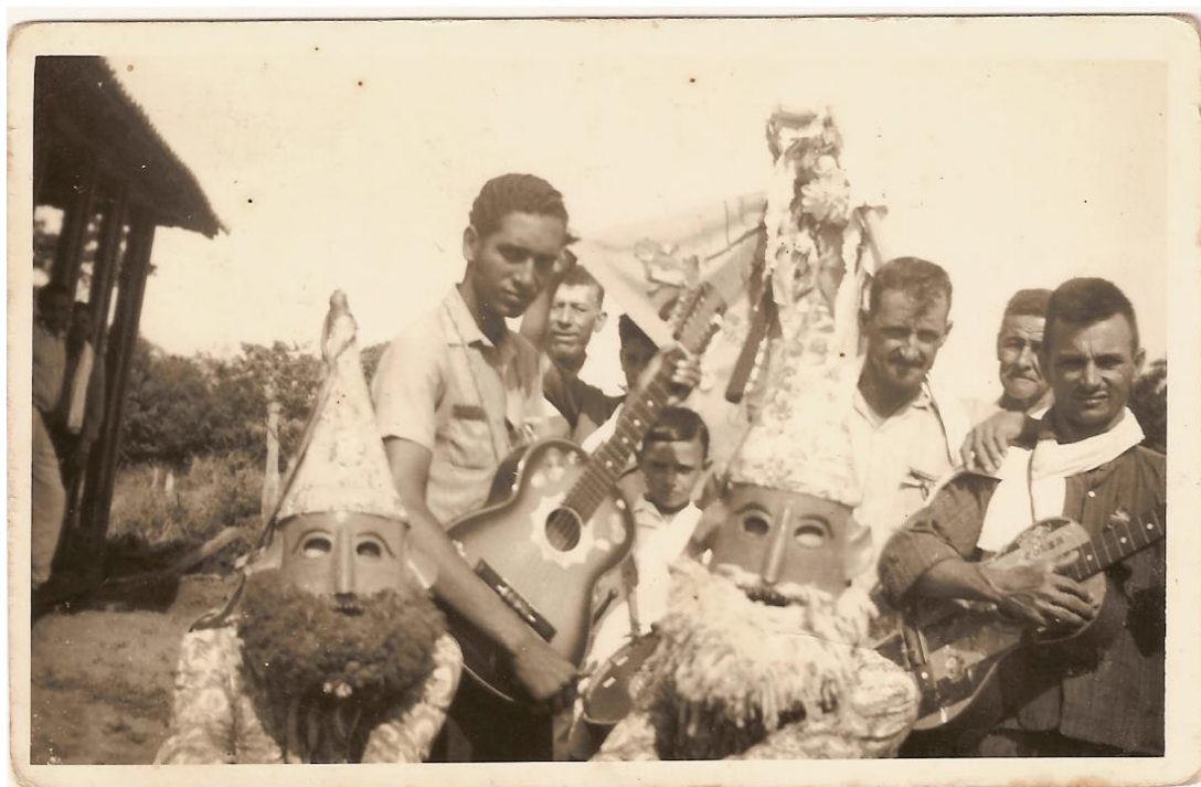
Figura 18 - Giro de Companhia de Santos Reis.*