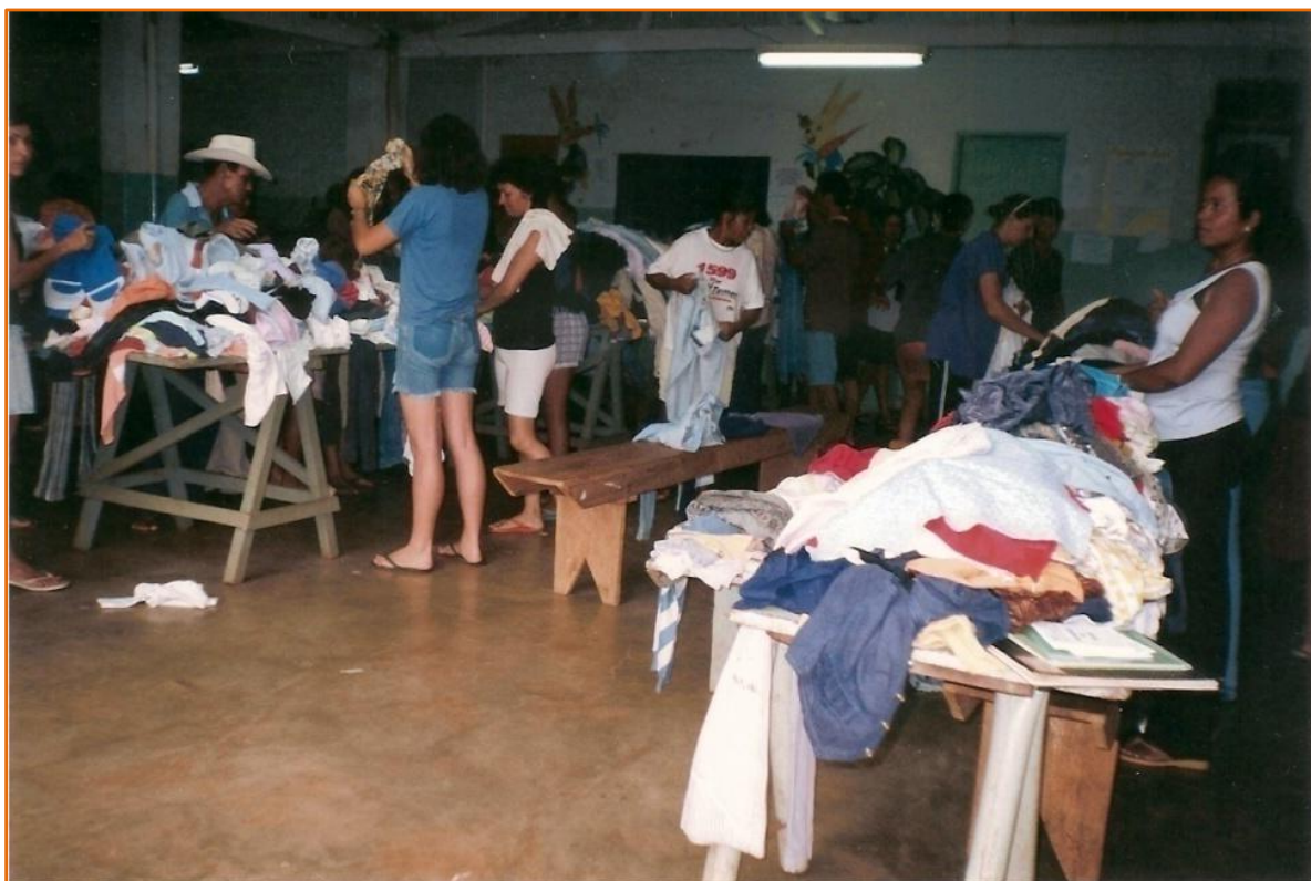
Figura 28 - Bazar da Pechincha improvisado no refeitório da creche municipal.*