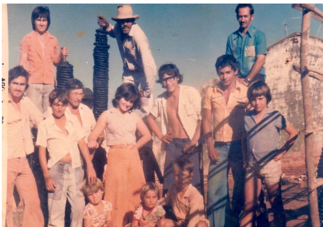
Figura 15 - Fabricação de tabaco.*

(abaixo, terceiro da esquerda para a direita, usando óculos, esposo da senhora Ilda), trabalhavam, finais de tardes, parte da noite, se necessário, ou dias inteiros para ajudar nas atividades de colheita. Catar as folhas maduras no campo, estender as folhas de fumo nos estaleiros fabricados de taboca ou varas nos galpões e tirar os talos das folhas no momento de enrolar o fumo, eram atividades consideradas leves, destinadas às crianças e mulheres. Os homens ocupavam-se de atividades que exigiam mais força física, como carregar os balaios com as folhas, mais especializadas, como supervisionar a colheita, ver quais folhas estavam maduras. No processo de produção, acompanhar o momento de tecer as folhas dando formato de uma corda que era enrolada em varão de madeira, até o ponto do produto ser comercializado. “Tudo era muito bom naquele tempo, apesar das dificuldades, o povo ajudava um ao outro sem a preocupação de quanto ia ganhar. Sabia que, se precisasse, alguém também os ajudaria”. 132