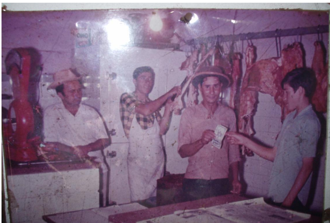
Figura 13 - Açougue.*

possibilidade de estar “pensando na construção de uma memória” 112 do comércio de Pontalinda, na década de 1970.