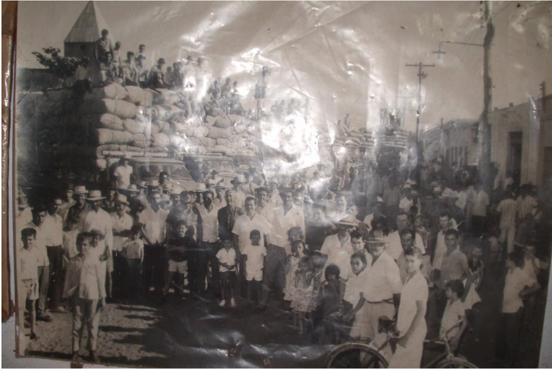
Figura 9 - Fotografia de caminhões carregados de algodão.*