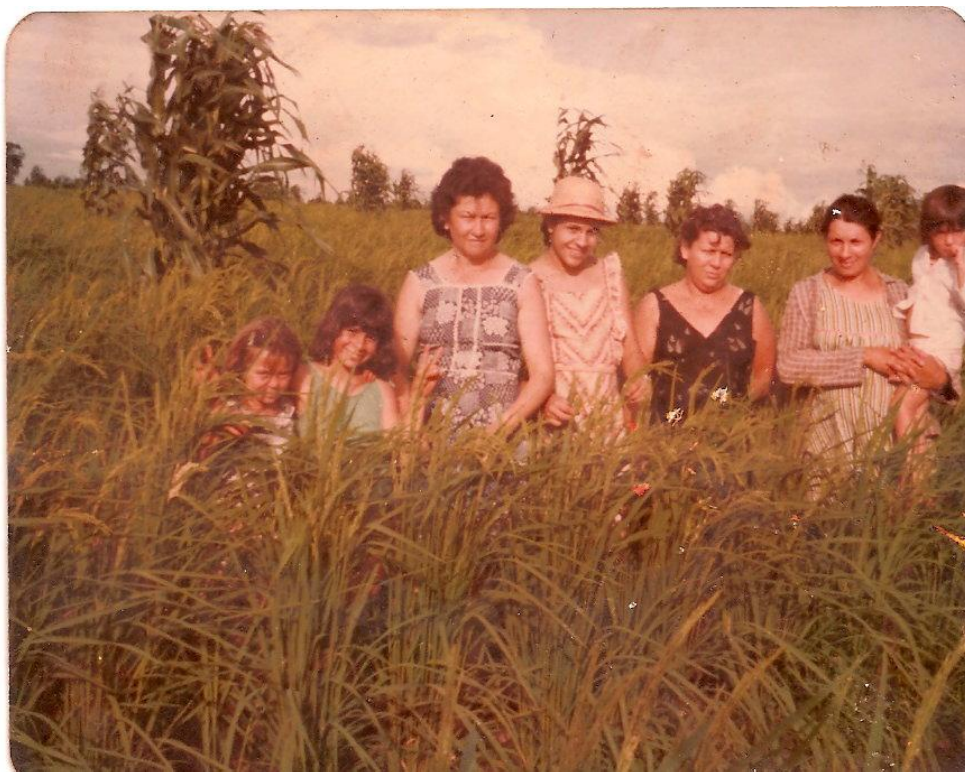
Figura 10 - Lavoura de arroz.*