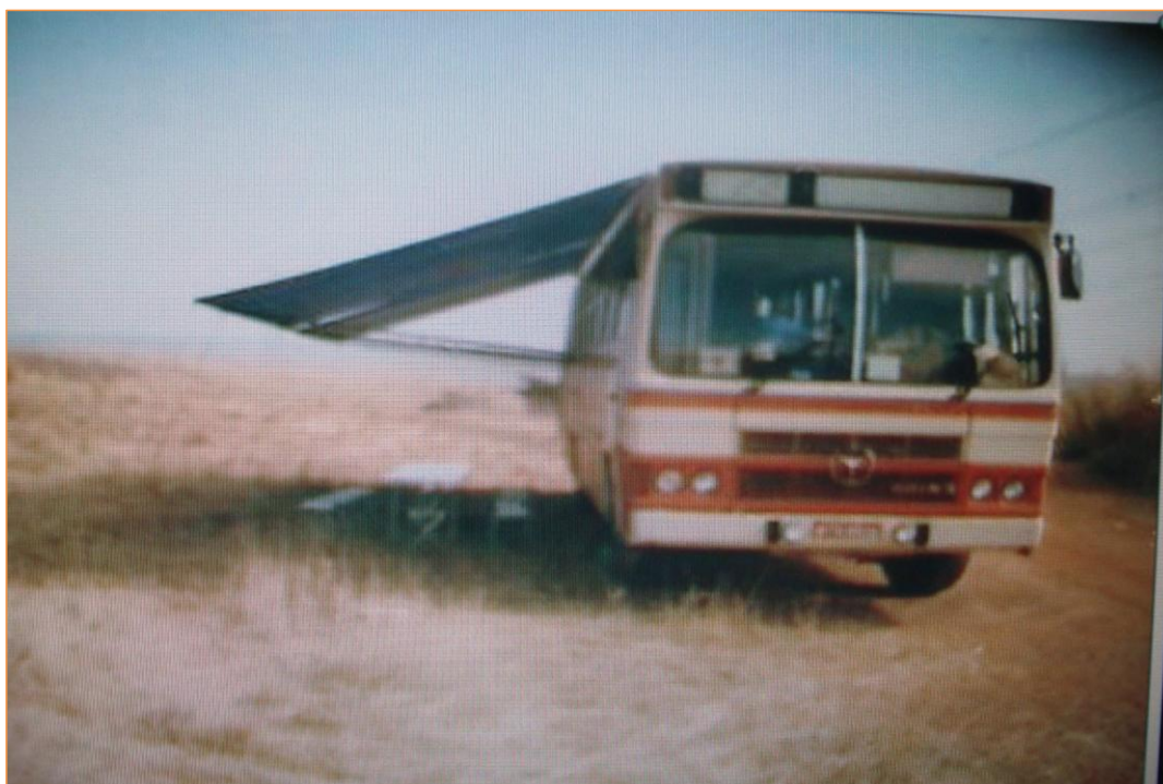
Figura 23 - Veículo de transporte de trabalhadores boias- frias.

A luta por algumas melhorias das condições de trabalho vem se arrastando ao longo dos tempos. A questão do banheiro é difícil para os trabalhadores, obrigados a fazerem suas necessidades fisiológicas em meio ao canavial, uma situação constrangedora para todos, ainda mais para as mulheres, sem arbustos e as folhas da cana queimada, reclamações que levaram o Ministério do Trabalho a obrigar donos de ônibus que transportam trabalhadores a instalarem banheiros, e a usina a improvisar banheiros desmontáveis no local de trabalho.