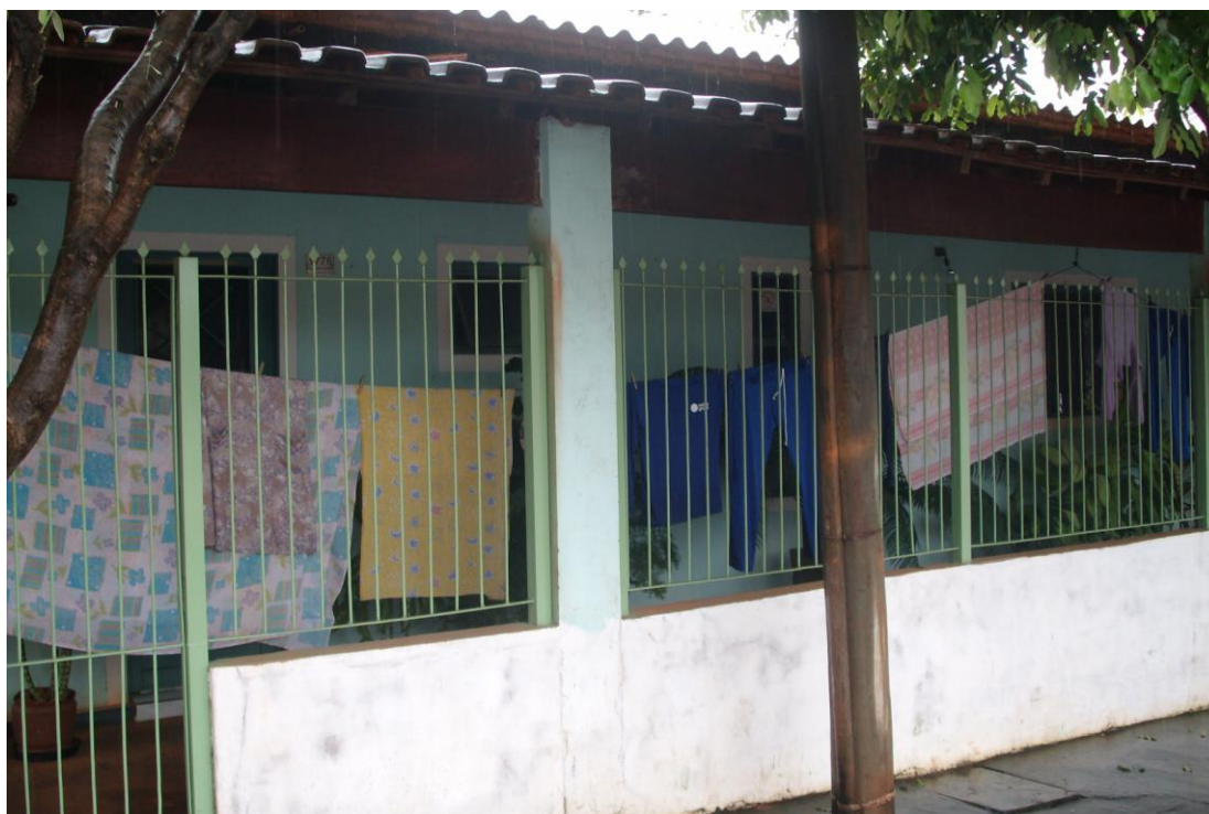
Figura 21 - Casa de bóia-fria reformada.

secarem, na área da frente de sua casa, construída dentro do projeto de reforma da mesma. A intenção da foto, tirada por ele mesmo, foi de “registrar a reforma” 224 de sua casa.