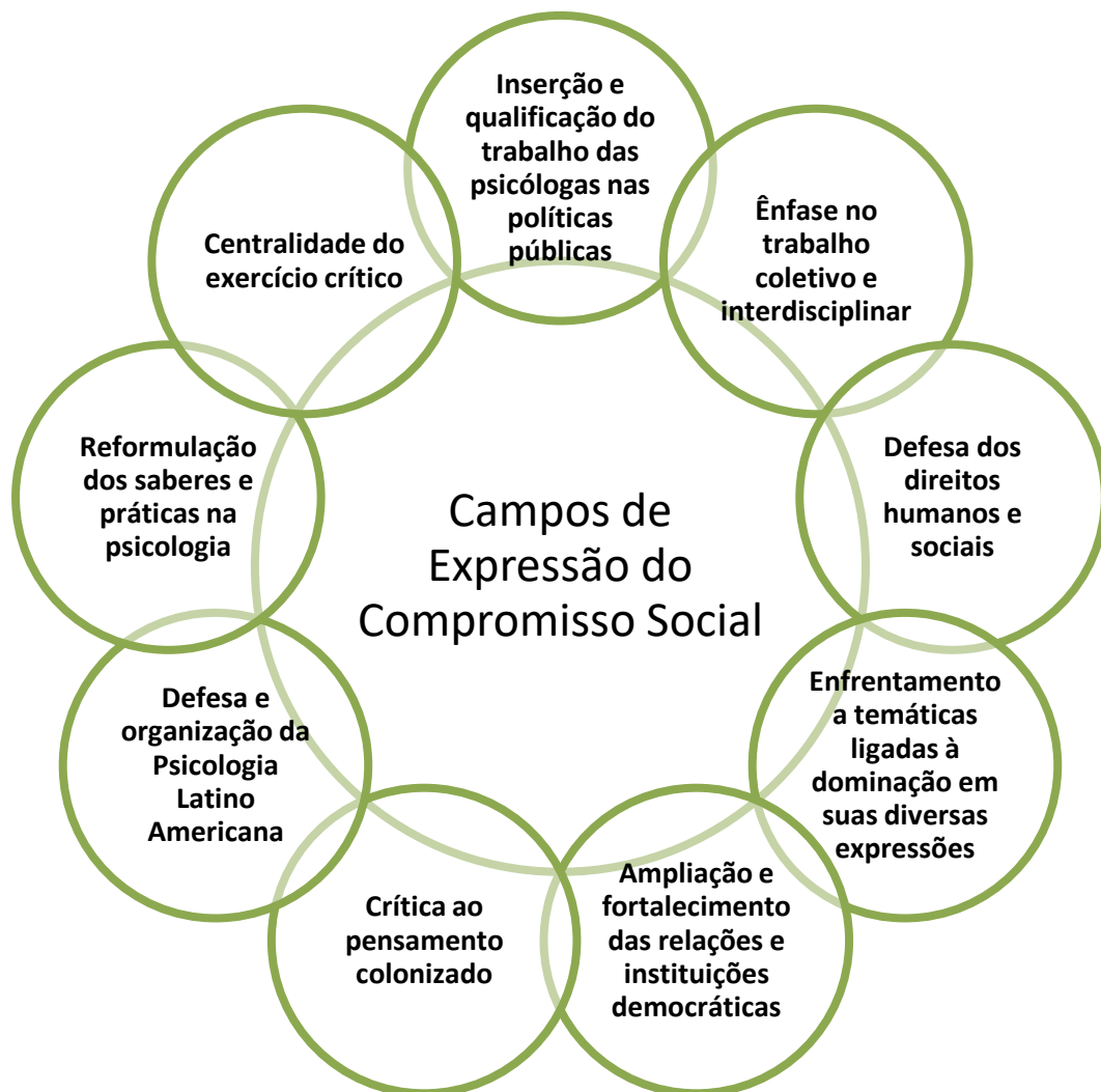
Figura 2 – Campos de expressão do projeto do compromisso social.

Apresentamos a seguir figura ilustrativa do esforço empreendido neste trabalho para registrar alguns dos campos de expressão do projeto do compromisso social da psicologia, que para fins didáticos aparecerão desdobrados. Reiteramos o reconhecimento da sua incompletude frente aos limites das fontes estudadas e à impossibilidade de apreensão de todos os impactos desse projeto, que possui diversas manifestações na psicologia e na vida social. Ademais, compreendemos esse estado inacabado como uma atitude de abertura às expressões que estão por ser construídas.