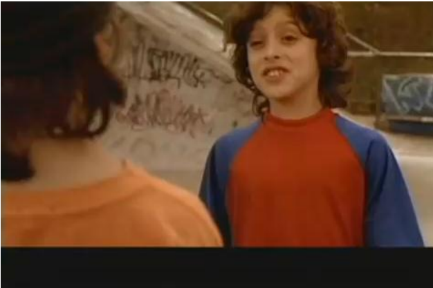
- De qual das duas você está falando? 7