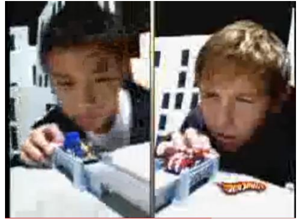
- Eles se enfrentam no campo de batalha frente a frente para baterem com toda a força.