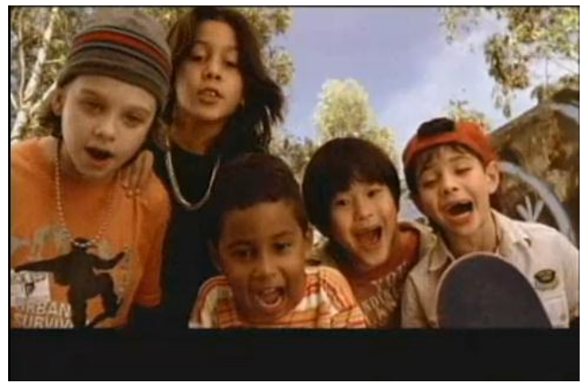
- Caraca! - Deixa eu ver? 10