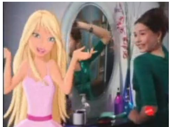
- Vamos mudar o visual