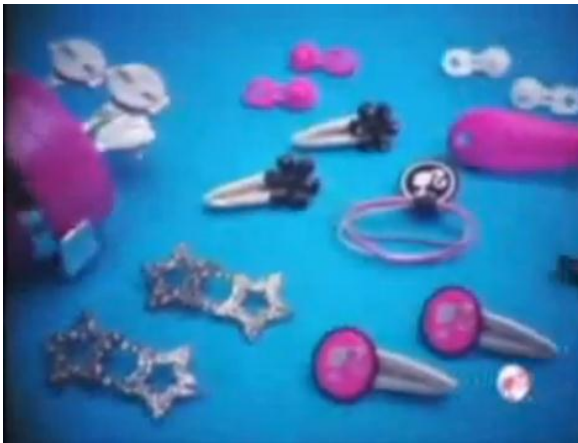
- Com a Barbie ficou muito divertido fazer suas tranças. 9