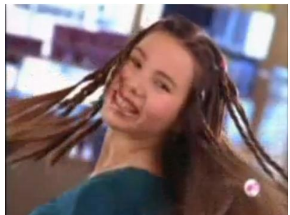
- Com tranças.