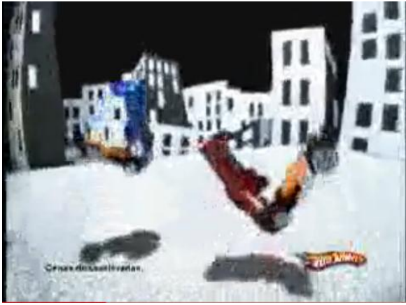
- Batidas de frente.