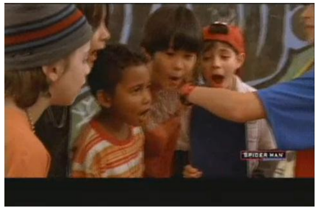
- Uau! 12