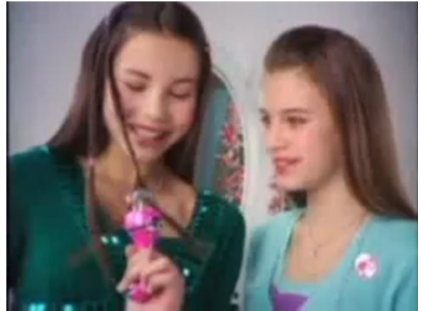
- Você e na Barbie 6