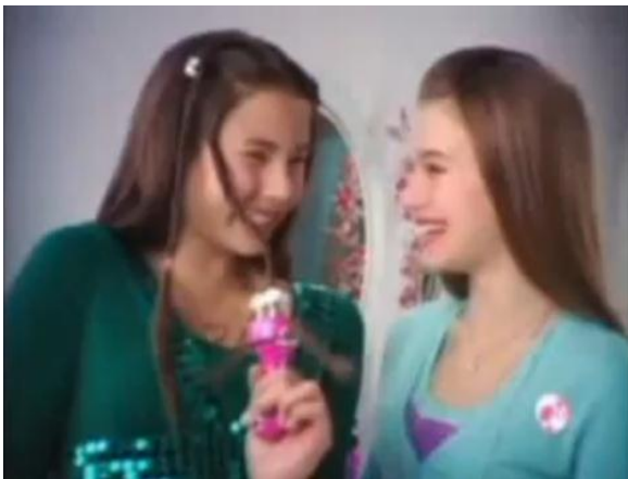
7 - É muito fácil.