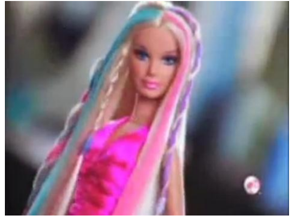
- Ultra Hair Mechas e Ultra Hair Tranças 18