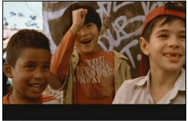
- Der! Essa uma aí no seu pé! 8