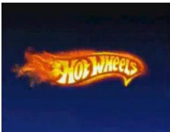
- Hot Wheels. Vai encarar? 1