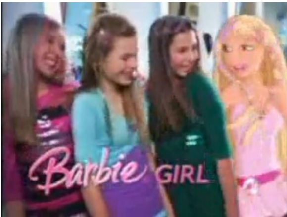
- Seja tudo o que você quiser. Barbie Girl. 19