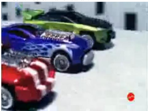
- São os Hot Wheels Crashers! 3