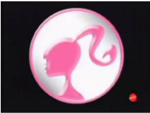
- Barbie Girl

A seguir, alguns fotogramas desta propaganda: