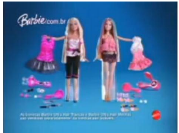
- Deixe suas Barbies lindas com Ultra Hair Look 20