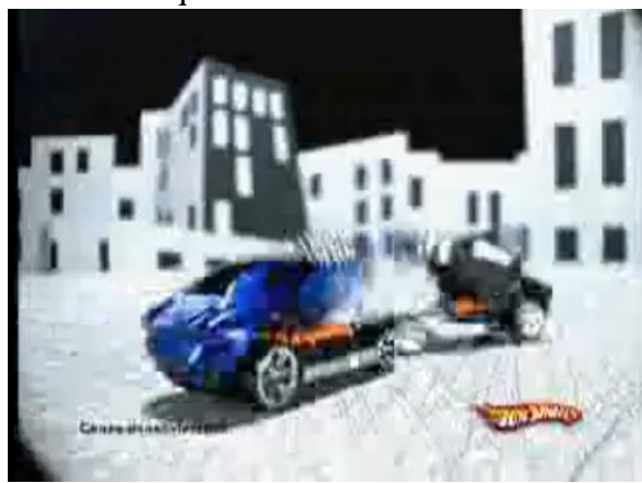
- Batidas traseiras. 4