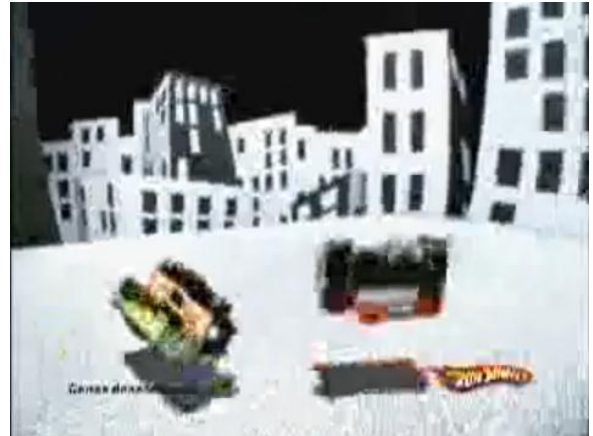
- Batidas de todos os lados. Animal!