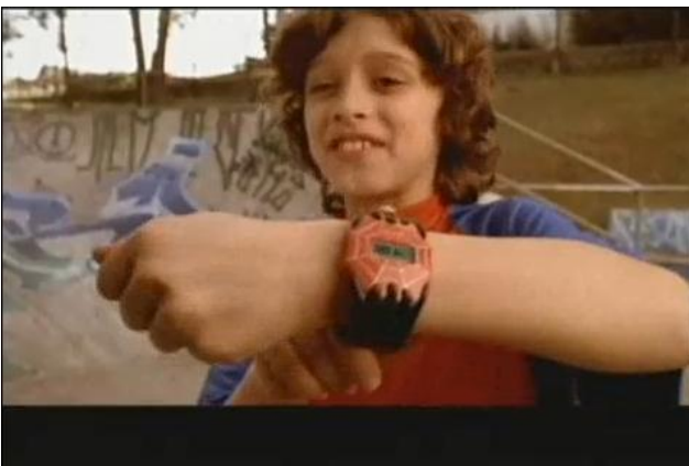
- Você vai ter que marcar hora. 11