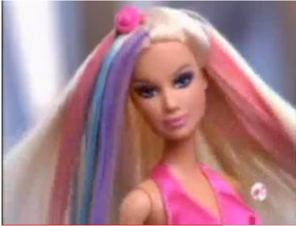
- Você vai adorar a Barbie Ultra Hair Mechas 17