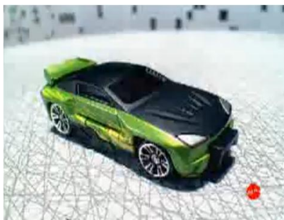
- Adivinha quem está detonando tudo? 2