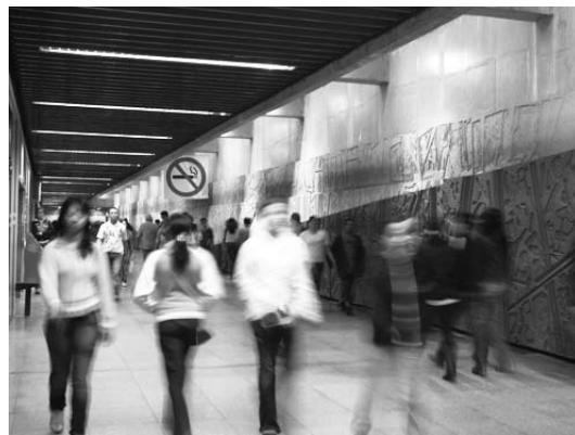
Diante do painel, lojas de pequenos objetos. Ao final do corredor, foto antiga da cidade de São Paulo. Grande número de passageiros transita pelo corredor diariamente.

Analisado do ponto de vista da criação de ambientes, o painel não está isolado. Em uma das extremidades do corredor está um outro painel, uma fotografia do centro da cidade de São Paulo tirada nas primeiras décadas do século XX. A foto de aproximadamente cinco metros de comprimento por