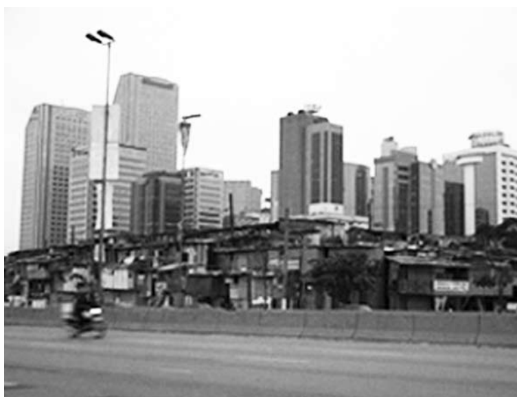
Vista a partir da Av. Roberto Marinho, onde se nota a favela (existente antes do desenvolvimento comercial da região)

Mas o interessante, como notou Milton Santos (2004), é que os ambientes criados pela razão global, apesar de produzirem fluxos comunicativos instantâneos e valorizarem a flexibilidade como aspecto maior da produção e do trabalho, na verdade, enfatizam a demanda por rigidez. “Pode-se, mesmo, dizer, sem risco de produzir um paradoxo, que a fluidez somente se alcança através da produção de mais capital fixo, isto é, de mais rigidez”. (Santos, 2004:252).