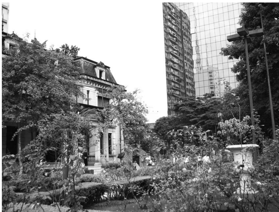
Casa das Rosas (construção do início do século XX) e prédio comercial construído na década de 1990

cultura. Um jardim une o antigo casarão ao seu vizinho, um prédio comercial construído na década de 1990. A fachada de vidro do prédio se contrapõe à antiga arquitetura; o jardim de rosas quebra a austeridade da estrutura de aço do arranha céu. Do outro lado da Avenida está o Hospital Santa Catarina, que conserva o prédio da década de 1920. Contrapõem-se e convivem o velho e o novo, o horizontal e o vertical, os elementos da natureza e as construções feitas pelo Homem.