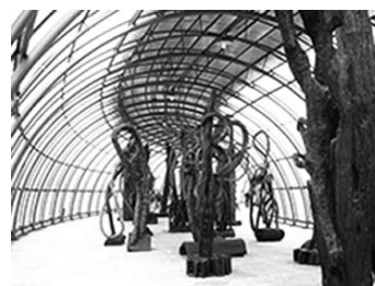
Espaço Franz Krajcberg no Jardim Botânico de Curitiba (PR).

Algo muito diferente acontece no espaço dedicado às obras de Krajcberg no Jardim Botânico de Curitiba. Cria-se, nesse contexto, a possibilidade de vínculo comunicativo num espaço que permite ser preenchido pelo uso. As obras (também criadas a partir de troncos queimados, além fotografias e depoimentos do artista), dentro da estrutura envidraçada banhada pela luz natural, convidam ao passeio, conduzem o trajeto, se disponibilizam ao toque e à contemplação. As próprias formas orgânicas criam o ambiente e não são ofuscadas pelo vidro e pelo metal, ou seja, pela estrutura que as abriga. Pelo contrário: a própria estrutura, ao formar um túnel, contribui para o desenvolvimento de um relacionamento ao induzir o observador a percorre-