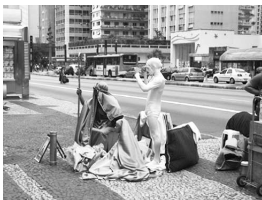
Vendedores ambulantes nos arredores da feira de artesanato. Estátuas humanas próximas à Estação Trianon-Masp do metrô.