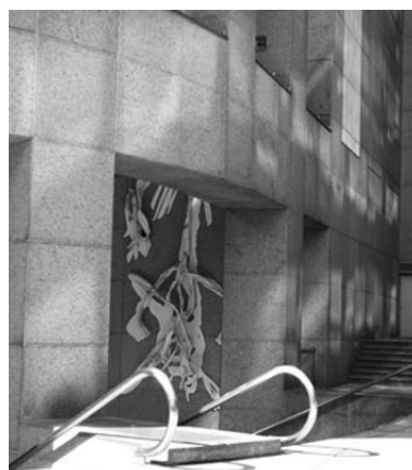
Escultura de Franz Krajcberg na fachada da sede do Citibank. Vista da calçada, a escultura é quase imperceptível.