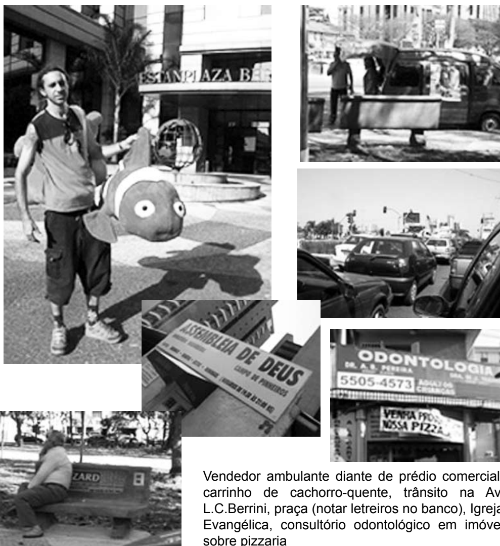
Vendedor ambulante diante de prédio comercial, carrinho de cachorro- quente, trânsito na Av. L.C.Berrini, praça (notar letreros no banco), Igreja Evangélica, consultório odontológico em imóvel sobre pizzaria

residuais e provocam certo grau de desordem no programa pré-estabelecido, “não obedecendo” à estrita aplicação mecânica das forças hegemônicas.